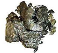
天然黒鉛 (土状黒鉛、 鱗状黒鉛)