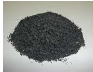
カルサインコークス