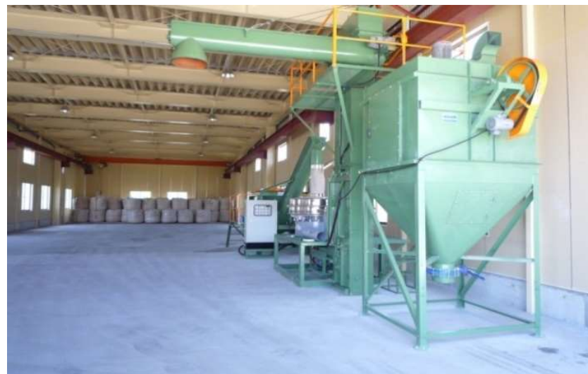
弊富山営業所倉庫内外観(1) (494㎡≒150坪)