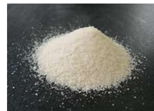
CMC(カルボキシメチル セルロース)