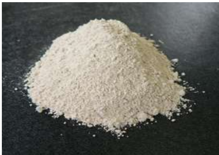
軽焼マグネシウム