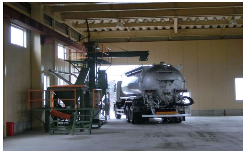
弊富山営業所倉庫内外観(2) (JP車による出荷)